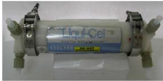
Ilustración IV-1. Módulo de fibras huecas Liquid-Cel empleado en el estudio llevado a cabo por la Universidad de Cantabria. (Bringas, 2008)