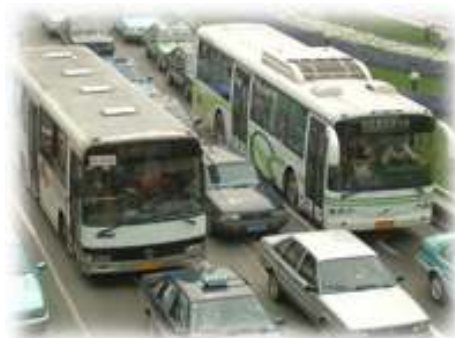
Figura 4.1 El transporte público en la actualidad.

El transporte es un motor del desarrollo económico y de bienestar general en todo el mundo. El aumento del nivel de vida lleva aparejado un crecimiento en los deseos de movilidad, propiciado tanto por las actividades comerciales o profesionales como por la demanda de ocio. Esto ha supuesto que las exigencias de movilidad en la sociedad actual sean cada vez mayores, y en consecuencia, el transporte de personas y mercancías se encuentra presente en un gran número de actividades cotidianas.